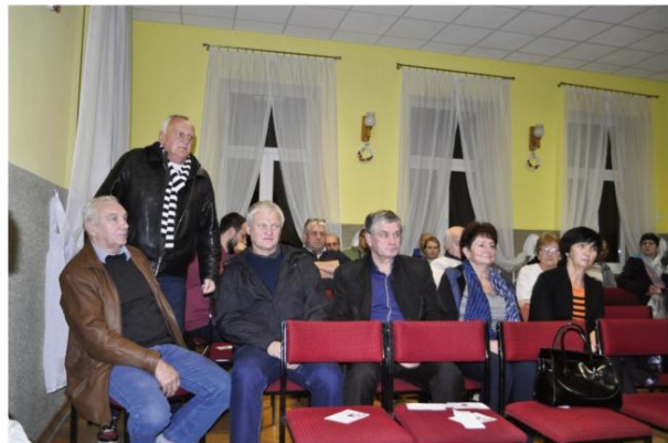
Na spotkanie w Domu Ludowym w Monowicach przybyli również samorządowcy z gminy Oświęcim.

Radny przekonywał członków Stowarzyszenia do dokumentowania każdej deklaracji składanej przez władze miasta Oświęcim. W przeciwnym bowiem razie nie ma podstaw do egzekwowania, jakie konkretnie działania zostały podjęte. Z kolei radny Stanisław Dziedzic namawiał do wywierania nacisku na Radę Miasta Oświęcim, dzięki czemu może się udać zwołanie specjalnej sesji poświęconej problemowi fetoru.