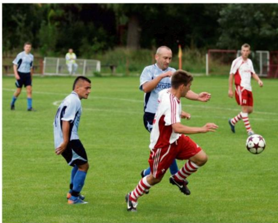
Kibice muszą uzbroić się w cierpliwość, bo kolejne mecze na boiskach klasy A i B dopiero na wiosnę przyszłego roku.

Na wiosnę rajszczanie będą gonili Zatorzankę z którą przegrali na wyjeździe w przedostatniej serii 1:0. Po pierwszej rundzie tracą do lidera zaledwie jeden punkt. Z kolei grójceka Solavia zameldowała się na jedenastej pozycji. Jesienią uzbierała dwanaście punktów. "Oczko" mniej ma drugi