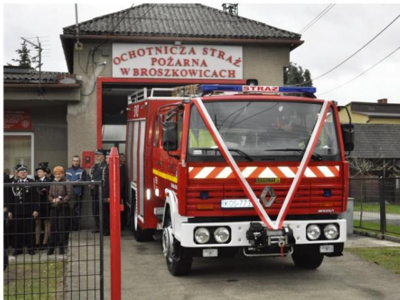
Uroczyste przekazanie i poświęcenie samochodu dla OSP Broszkowice 29 października 2016 roku.

wydać – zaznacza. – Można nakupić sprzętu, bo wciąż pojawiają się kolejne nowinki techniczne. Ale inwestycje