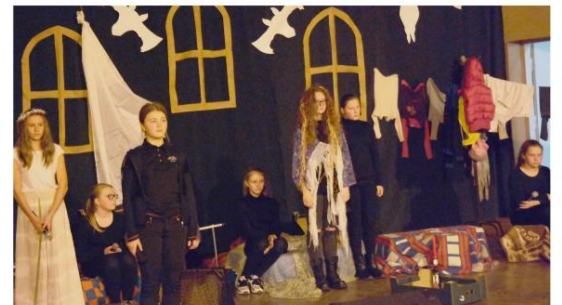
Uczennice klas szóstych w inscenizacji „Dziadów cz.2” Adama Mickiewicza.

Już czwarta rozgrywana wieczornica z okazji Narodowego Święta Niepodległości miała miejsce w Szkole Podstawowej w Babcicach.