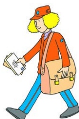
a postal worker